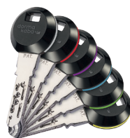
Os clips transponder RFID apresentam uma gama de 6 anéis coloridos, para uma fácil identificação