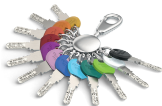
Para a chave standard , existem clips Smartkey em 12 cores